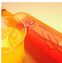
マンゴー梅酒 フルフル

山葡萄ならではの野性味あふれる酸味と甘味。 ストレート、ロック、ソーダ割りでお楽しみ下さい。