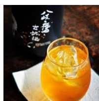
八岐の梅酒 古城梅