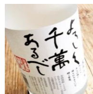
よろしく千萬ある